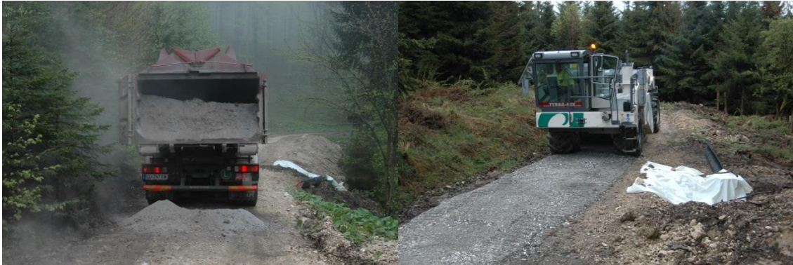
Aufbringung von Holzasche durch abkippen (links), Vermischung mit dem zu stabilisierenden Boden mittels Fräse (rechts)

Die Verarbeitung von Holzasche als Bindemittel erfordert im Vergleich zum konventionellen Forststraßenbau erhöhten Personal- und Maschinenaufwand und eventuell entstehen Kosten für die Beimengung von Kalk. Da die Asche aber kostenfrei zur Baustelle geliefert werden kann, und somit die, mit dem Einbau von Schotter verbundenen Kosten einspart, entsteht bei längeren Forststraßenprojekten (ab ca. 500 lfm) ein deutlicher Kostenvorteil beim Einsatz von Holzaschen.